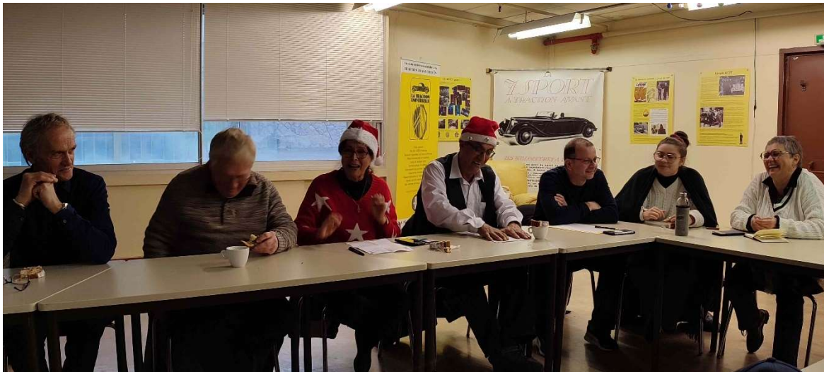
Ambiance détendue à l'assemblée Générale Régionale 2022 de la section TU-AFC