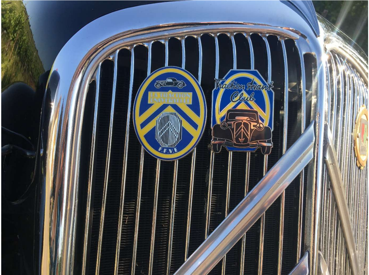
Badges de calandre TU et CTAC, y'a comme une ressemblance ;