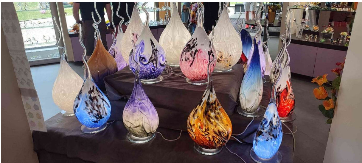
Petit tour obligé dans le très beau magasin expo ou certains, surtout certaines, se sont fait bien plaisir ;