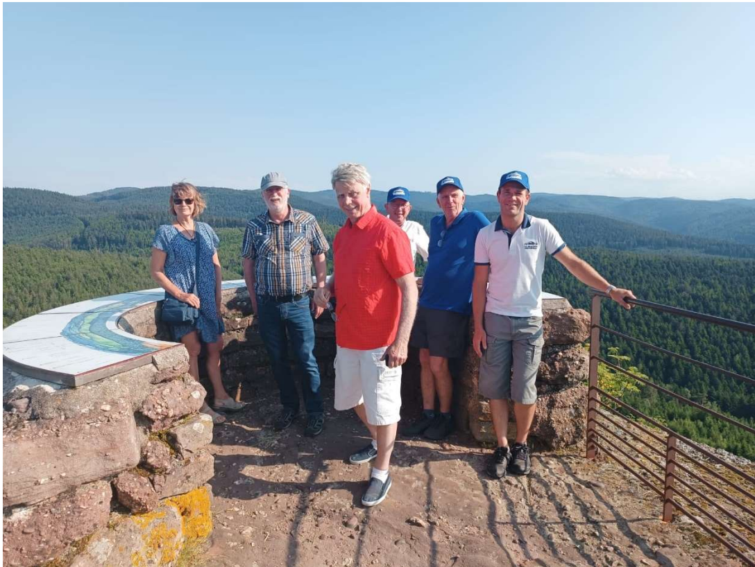
Rencontre au sommet - rocher de Dabo

C'est donc une rencontre au sommet franco-suisse qui a eu lieu la ce dimanche, alors qu'en 1983 MITTERAND rencontrait KOHL a quelques pas de la ;