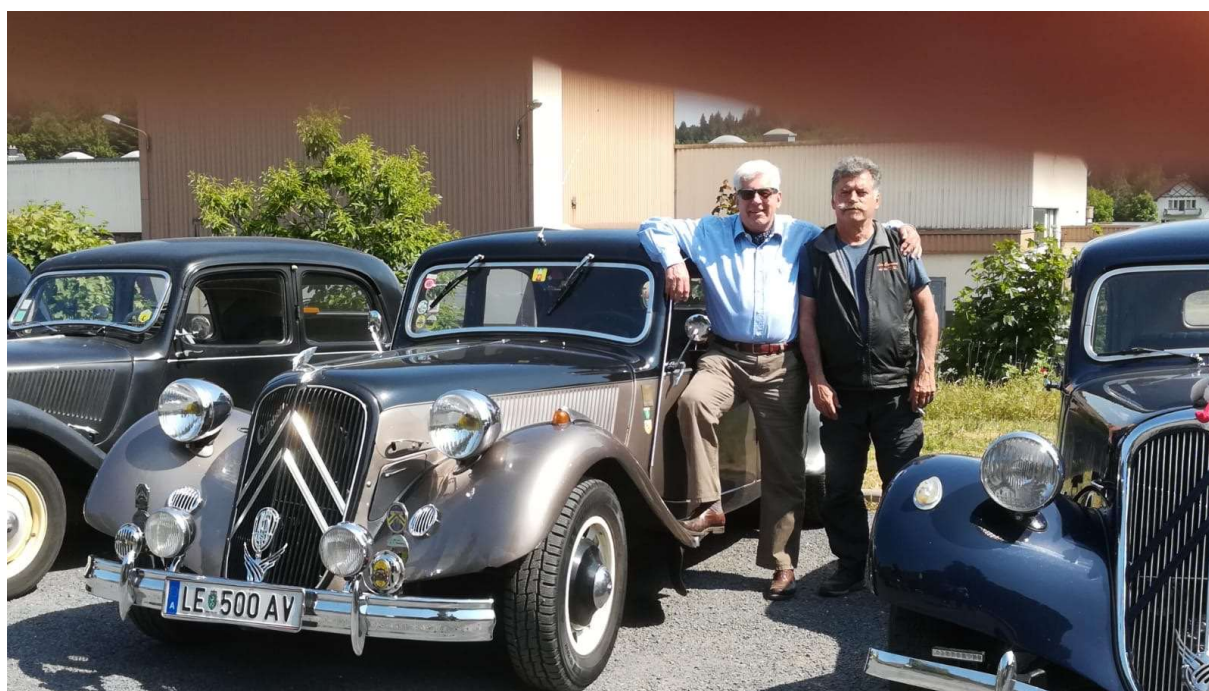
Rapprochement Austro-Lorrain ;