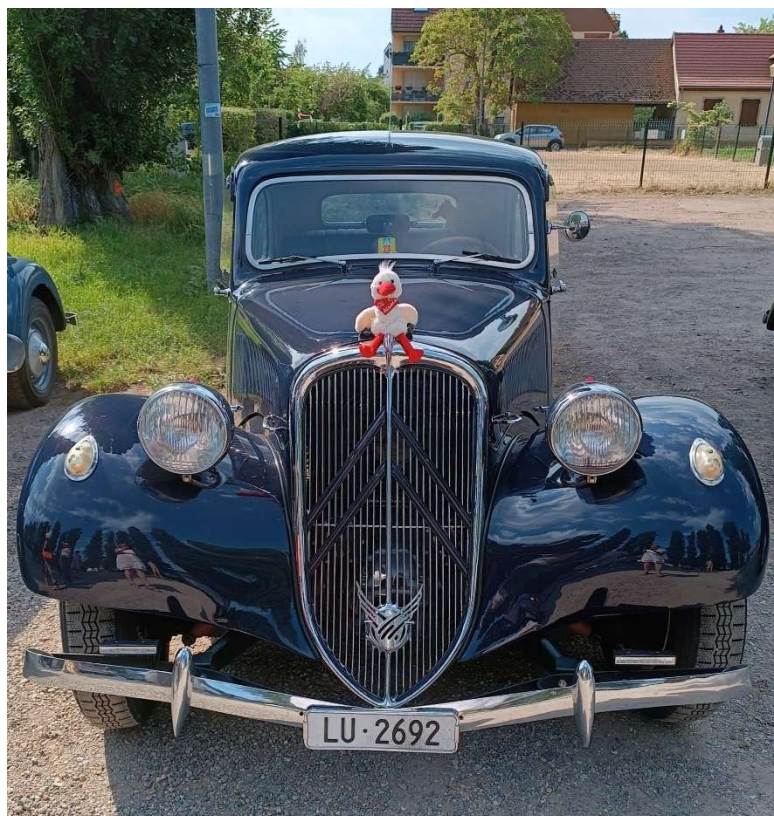
LA TRAS (Trac Alsaco Suisse)