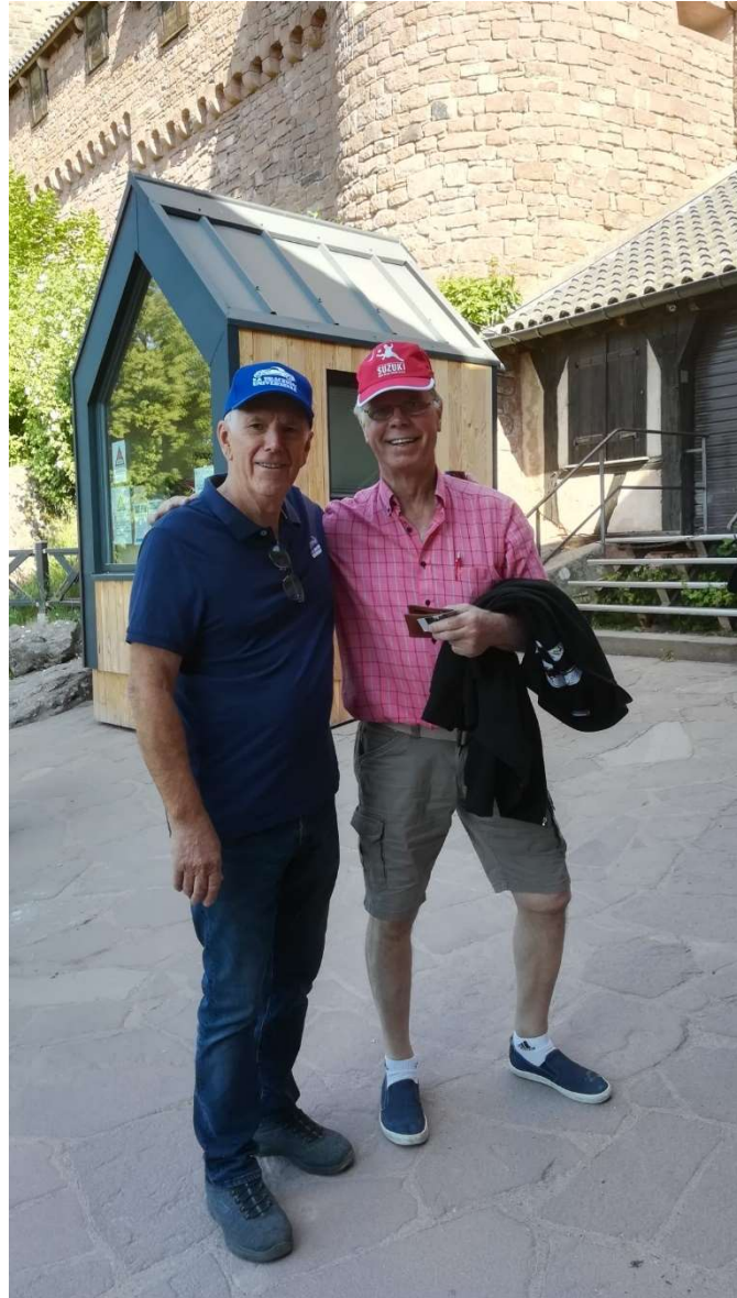
Et Alsaco -Suisse