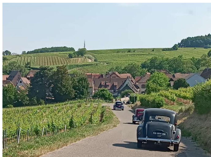
Dans le vignoble